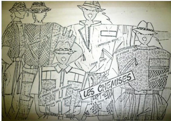
Une nouvelle voie textile empruntée par Dalle & Cie dans la mode des années 1980 : les rubans et les pièces à façon.

Dans les années 1980, en plus d'une collection dénommée « Les Mercenaires de la paix », remettant en valeur le vrai kaki et les vraies couleurs de camouflage héritées de la mode militaire, le tout mêlé aux motifs dits « ethniques », Dalle créa même un kit permettant aux dames d'assembler elles-mêmes les différentes pièces d'un soutien-gorge !