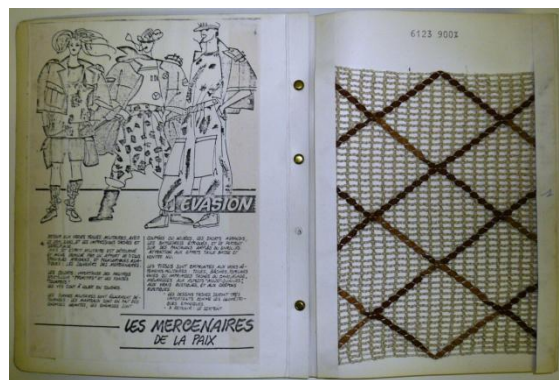
Quand Dalle prend le train de la mode « jeune » en marche, les tissus « militaires » reprennent du galon (années 1980).

Parmi les grandes entreprises rubanières de notre région, « Dalle & Cie », située à Wervicq-Sud, s'est fait une spécialité dans le ruban décoratif et, plus particulièrement, dans le domaine de la passementerie. Mais elle fut aussi la créatrice de pièces de tissus en tous genres. A sa grande époque, elle aura, en plus d'une salle d'exposition de prestige à Paris (boulevard de Sébastopol), une autre usine à Saint-Etienne.