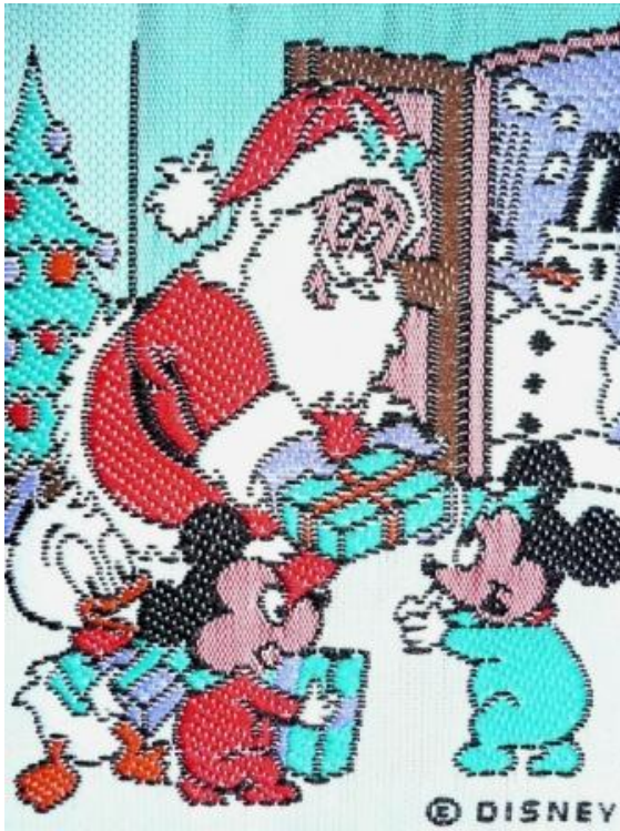
Quand Disney fêtait Noël tout en rubans... (MRc932).