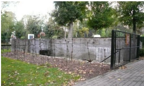
Le blockhaus des pionniers allemands, devant le Musée de la Rubanerie, rappelle l'occupation de Comines de 1914 à 1918.

Le reste du journal évoque encore les fraudes et leur(s) conséquences, la nomination par l'occupant des professeurs ainsi que les condamnations encourues suites aux restrictions des denrées alimentaires.