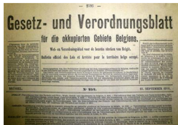
La rubanerie belge et la grande guerre : des lois iniques...

Il s'agit du « Bulletin officiel des Lois et Arrêtés pour le territoire belge occupé » n°252 du 10 septembre 1916. En plus de son prix (en pfennig, témoignant de l'imposition par l'occupant, de sa monnaie nationale), le sommaire annonce la couleur d'une époque durant laquelle la difficulté de survivre transparait à chaque paragraphe ! En effet, la puissance belligérante y définit et explique sans ambages les restrictions auxquelles sont soumis les rubaniers, bonnetiers et autres tisserands. A la lecture du document, notamment l'« Arrêté concernant le trafic des tissus, de la bonneterie (articles de tricot, etc.) et des articles de rubanerie en Belgique », tout est bien clair !