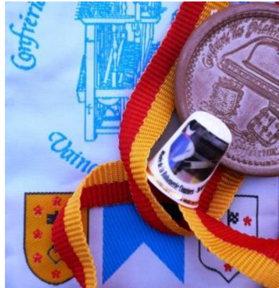
Le nouveau souvenir des rubaniers cominois !

Pour étoffer (et renouveler) sa gamme de colifichets souvenirs, le Musée de la Rubanerie cominoise, toujours à l'écoute des souhaits de ses visiteurs, a décidé de répondre à une demande récurrente et débute 2012 avec la commercialisation d'un dé à coudre tout en céramique, frappé d'une image reprenant le marmouset, son métier à tisser et sa navette à main. Fabriqué à Lamballe (Bretagne), ce dé à coudre inédit vient tout juste de sortir des ateliers de « La Guilde du Dé » et vous attend désormais à l'accueil du Musée où vous pourrez l'acquérir pour 3 € seulement. Voilà qui, en plus de porter nos couleurs auprès des collectionneurs, devrait appeler, en ces mois froids, à une recrudescence d'ouvrages manuels de précision !